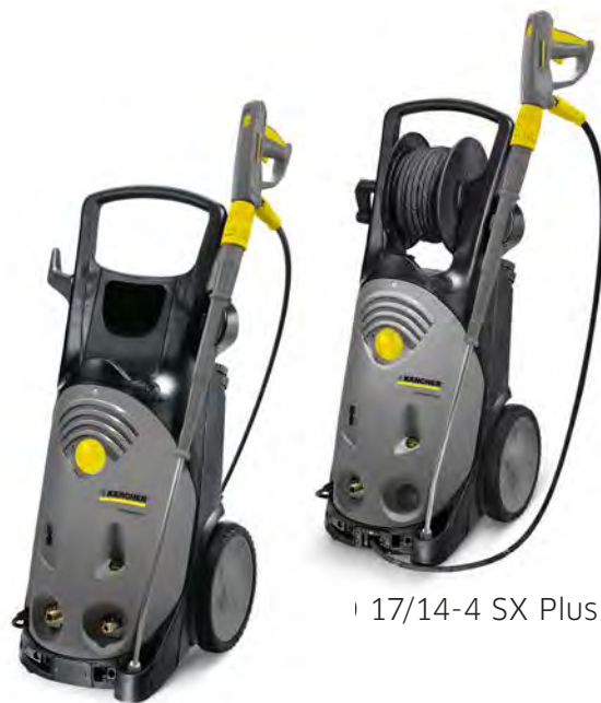
HD 17/14-4 SX Plus